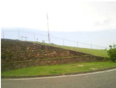
Cerca en el Talud Sur de la Pista