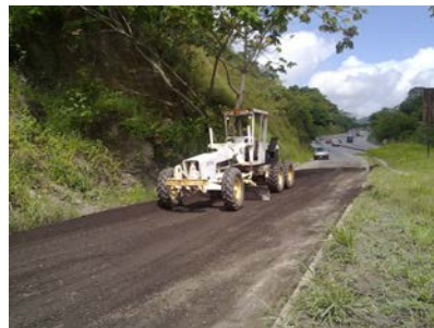
Asfalto reciclado en el Distribuidor

Con una inversión estimada de Bs. 100.000, iniciamos el reemplazo de la cerca en el talud sur de la pista.