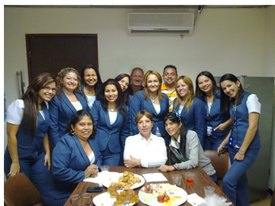
Con algunos compañeros de trabajo